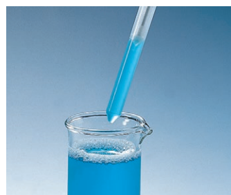
Principe du déplacement positif

Les milieux ayant tendance à mousser, comme les solutions tensio-actives, ne posent pas de problème au Transferpettor.