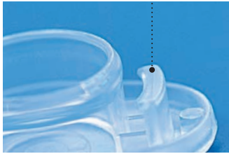
Gancho del cierre de tapa

El cierre de tapa de los nuevos microtubos de BRAND protege contra una abertura accidental de la tapa.